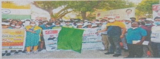
▶ 2.0 ஓட்டத்தை கலெக்டர் ராகுல்நாத் கொடியசைத்து துவங்கி வைத்தார்.

மேலும், செங்கல்பட்டு மாவட்டம் முழுவதும் இன்று நடக்கும் கொரோனா சிறப்பு தடுப்பூசி முகாமில், 18 வயதுக்கு மேற்பட்ட அனைவரும் தடுப்பூசி செலுத்து கொள்ள வேண்டும் என அறிவுறுத்தி, கொரோனா தடுப்பூசியின் அவசியம் குறித்து விழிப்புணர்வு ஏற்படுத்தப்பட்டது. தொடர்ந்து, ஓட்டத்தில் பங்குபெற்று முதல் 3 இடம் பிடித்த மாணவ, மாணவிகளுக்கு பரிசுகள் மற்றும் சான்றிதழ்களை கலெக்டர் ராகுல்நாத் வழங்கினார்.