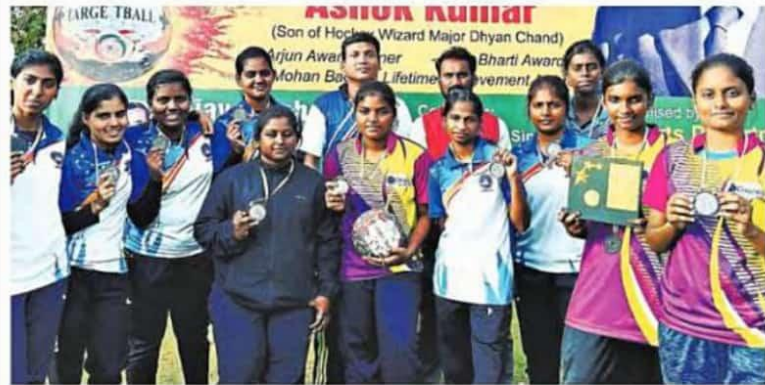
■ இலக்குப்பந்து போட்டியில் வெண்கல பதக்கம் வென்ற தமிழக அணி. இடம்: மதுரா, உ.பி., மாநிலம்.

கேற்று, லீக் மற்றும் நாக் அவுட் போட்டிகளில் வெற்றி பெற்றனர். அதன் தொடர்ச்சியாக, மூன்றாவது இடத்திற்கான போட்டிக்கு தகுதி பெற்றனர். இதில், தமிழக அணி - தெலுங்கானா அணி இடையே பலப்பரிட்சை நடந்தது. அதில், 6-5 என்ற புள்ளிக் கணக்கில், தமிழக அணி வெண்கல பதக்கம் வென்றது.