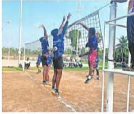
■ வாலிபால் போட்டியில் பங்கேற்ற அணிகள். இடம்: வண்டலூர்.

போட்டியில், தமிழ்நாடு உடற்கல்வி மற்றும் விளையாட்டு பல்கலை முதலிடத்தையும், சி.எஸ்.ஐ., பள்ளி இரண்டாம் இடத்தையும் பிடித்தன.