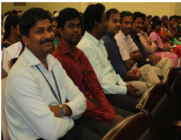
Interaction session with Male Faculty member(s)