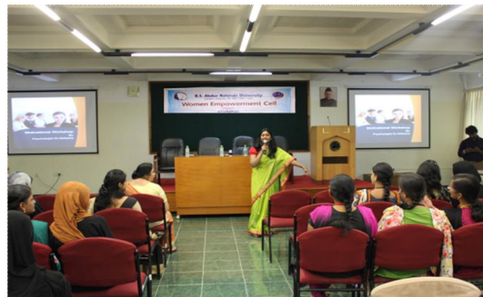
The resource person Dr. Abilasha addressed the audience