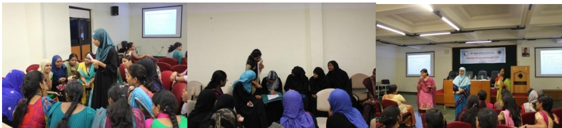
Group discussion and interaction session