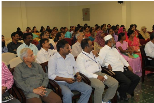
Senior Professors attended the workshop